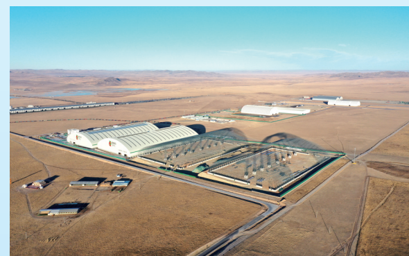
珠恩嘎达布其百万吨储煤基地一期项目投入运营。

为推动国家向北开放重要桥头堡建设搭建桥梁纽带。国道207线水库至豁子梁段公路是国道207线乌兰浩特至海安公路的重要组成部分,是锡林郭勒盟“五横五纵”公路网主骨架中“纵二”的重要组成部分。实施国道207线水库至豁子梁段公路项目,将实现国道207线在锡林浩特市过境区域快速连接,打通锡林浩特市63.4公里外环线,使锡林浩特市外环线及4条国道主干线实现无缝衔接。国道207线水库至豁子梁段公路项目于2023年7月开工建设,2024年9月完成竣工验收并通车试运行。锡林郭勒盟以太锡铁路、“绿动进呼”为抓手,全面布局“三横五纵、通两疆、达六港”铁路网。其中,太锡铁路项目完成投资3.76亿元,投资完成率达67.14%,预计2026年建成开通,助推京津冀西北生态发展带与锡林郭勒盟旅游产业进一步融合发展。畅通跨境寄递服务通道,1月至11月,处理转口直封邮件1007袋,总重量6052KG;出口直封1137袋,总重量7896.1KG。