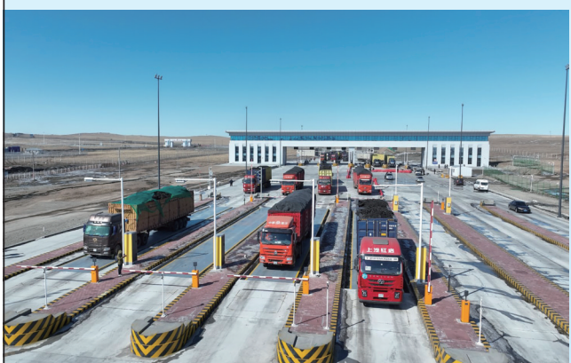
珠恩嘎达布其口岸新建货运通道正式启用。

2023年11月4日,二连浩特公路口岸恢复8座以下小型车辆通行,成为全区首个8座以下小型车辆恢复通关的口岸。2024年3月20日,珠恩嘎达布其口岸恢复8座以下小型车辆通行,有力促进了与蒙古国毗邻地区在人文交流、经贸投资、跨境旅游等领域深度合作。