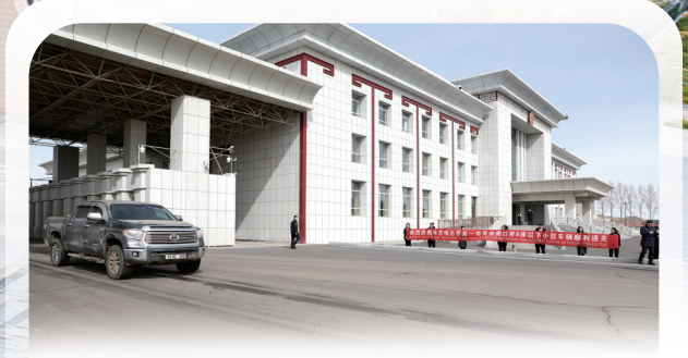
珠恩嘎达布其口岸至毕其格图口岸8座以下小型车辆正式通关。