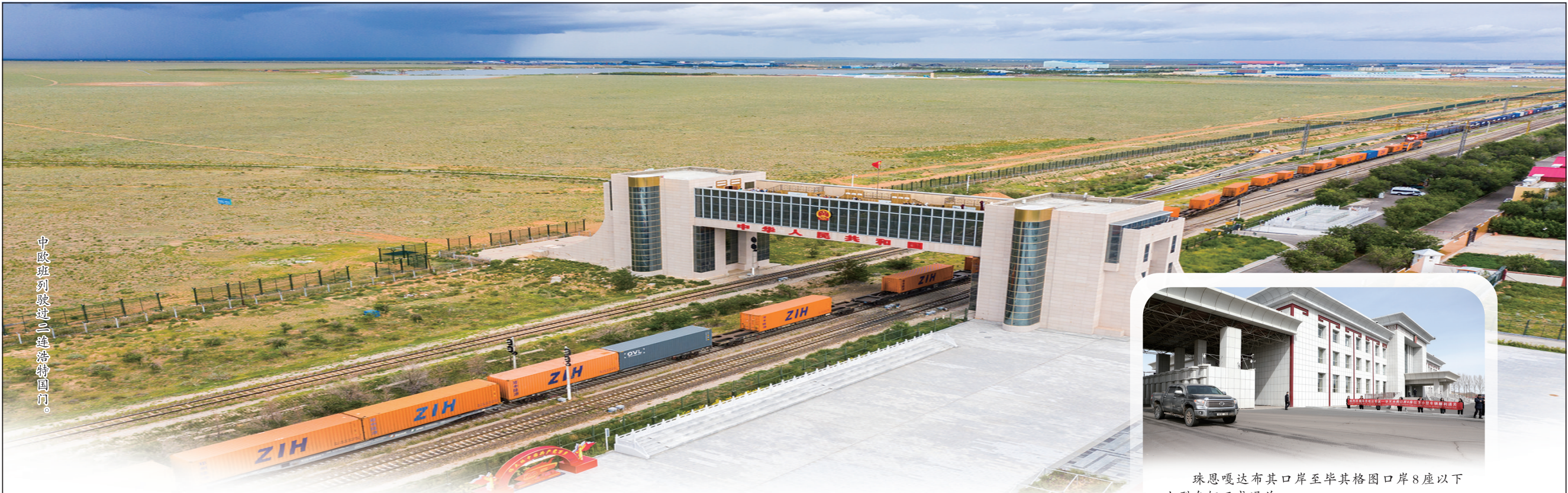
中欧班列驶进二连浩特国门。