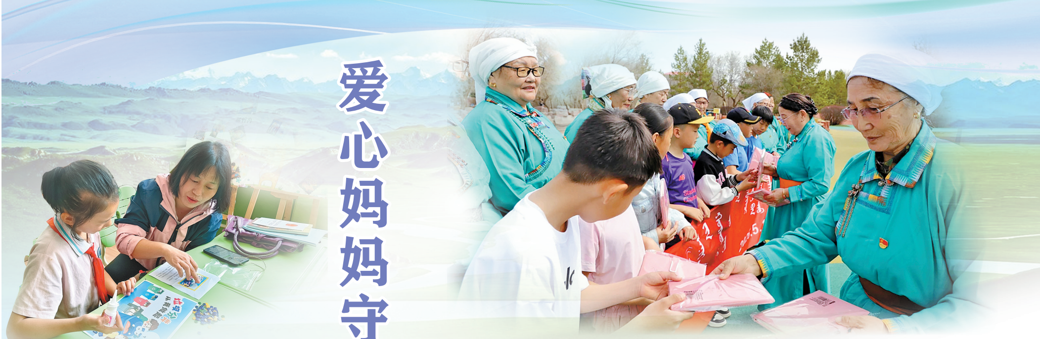
锡林郭勒盟西乌珠穆沁旗爱心妈妈为孩子送文化用品。