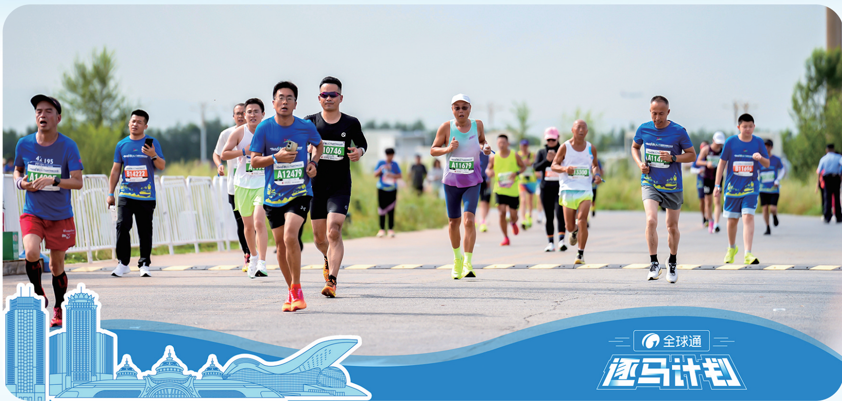
2025 敕勒川草原半程马拉松现场。

8月17日,2025 敕勒川草原半程马拉松赛在呼和浩特市风光壮美的敕勒川草原鸣枪开跑,吸引了来自全国各地的万余名跑者参与。中国移动内蒙古公司作为赛事官方支持运营商,以高度的社会责任感和卓越的通信保障能力,全力护航赛事成功举办,并通过“全球通·逐马计划”深度融入赛事,积极服务自治区文体事业发展和健康内蒙古建设。