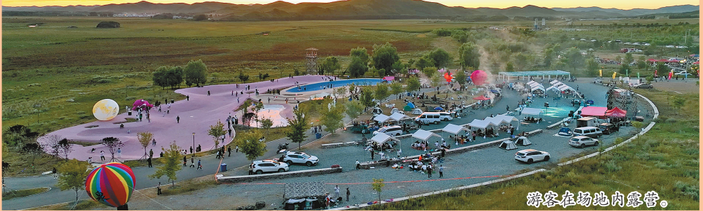
游客在场地内露营。