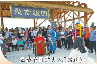
互动节目“大人”驾到。