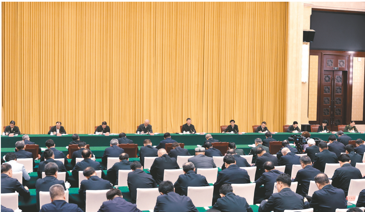
9月24日下午,率中央代表团出席新疆维吾尔自治区成立70周年庆祝活动的中共中央总书记、国家主席、中央军委主席习近平在乌鲁木齐听取新疆维吾尔自治区党委和政府工作汇报,发表了重要讲话。

新华社乌鲁木齐9月24日电 率中央代表团出席新疆维吾尔自治区成立70周年庆祝活动的中共中央总书记、国家主席、中央军委主席习近平,24日听取新疆维吾尔自治区党委和政府工作汇报。他强调,新疆要完整准确全面贯彻新时代党的治疆方略,坚持稳中求进工作总基调,统筹发展和安全,牢牢扭住社会稳定和长治久安工作总目标,紧紧围绕铸牢中华民族共同体意识,推进中华民族共同体建设,锚定中央赋予的“五大战略定位”,凝心聚力、久久为功,努力建设团结和谐、繁荣富裕、文明进步、安居乐业、生态良好的社会主义现代化新疆。