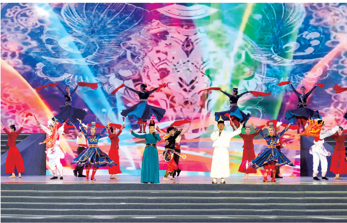
筑梦红山·农牧传情——第十八届红山文化旅游节赤峰市非物质文化遗产专场晚会。

从入选人类非遗代表作名录的民间文学巴林右旗《格萨(斯)尔》史诗到赤峰雅乐、昭乌达民歌及蒙古族汗廷音乐等传统音乐;从翁牛特秧歌、宁城抬阁背阁等传统舞蹈到融合雕刻、彩绘与表演艺术的传统戏剧巴林左旗皮影戏;从胡仁乌力格尔、岱日拉查等曲艺到兼具竞技性与娱乐性的萨仁靶射箭、搏克等传统体育项目,不断丰富着人民群众的文化生活;巴林石雕与玉雕、剪纸彰显民间艺术之美;蒙古包、勒勒车制作体现工匠精神;中(蒙)医诊疗法、陈氏骨伤疗法守护民众健康;游牧移场习俗、婚庆礼仪等民俗,展现广泛的群众参与性……这些珍贵的非遗资源,犹如一颗颗璀璨的明珠镶嵌在赤峰大地上,展现出赤峰地域文化的多元风格和当代活力,体现“你中有我、我中有你、谁也离不开谁”的多元一体格局。