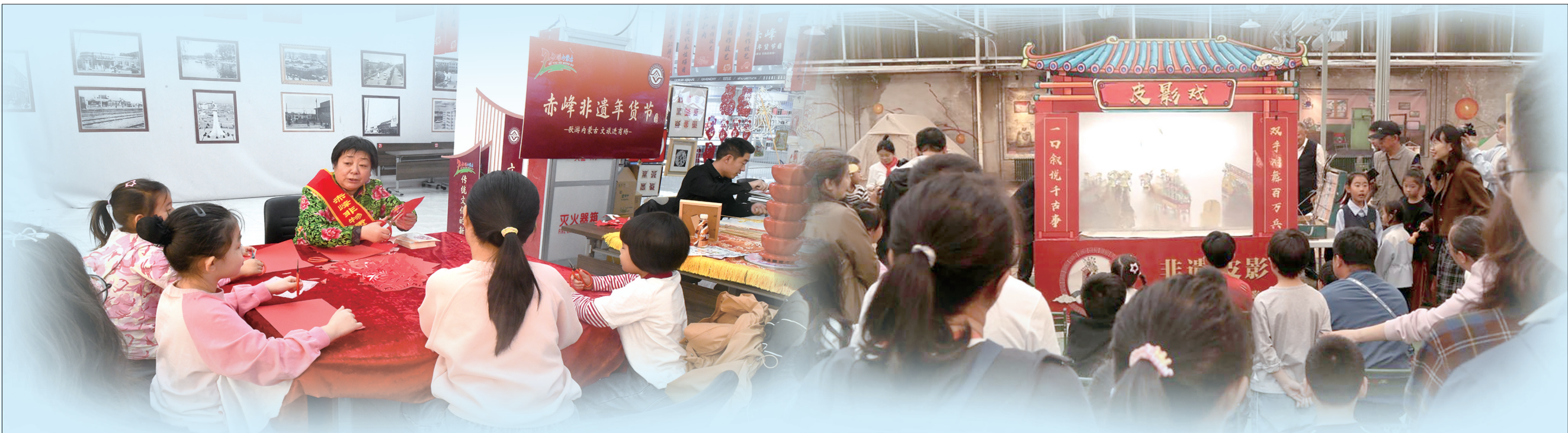
2025年赤峰非遗年货节。