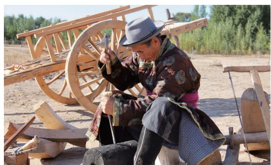
国家级非物质文化遗产代表性项目蒙古族勒勒车制作技艺。