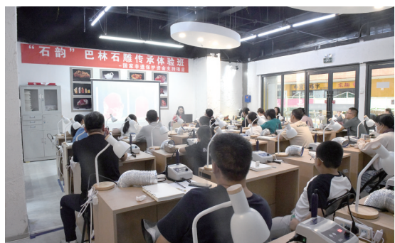
“石韵”巴林石雕传承体验班。