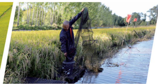
稻农在“稻—虾”共生田起网捞虾。