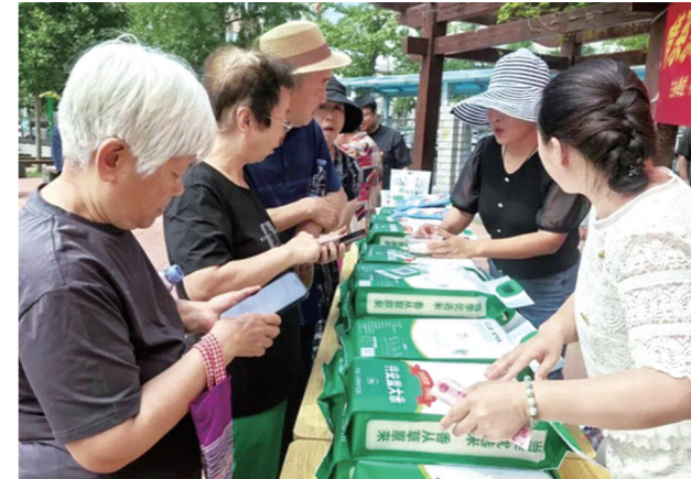
北京市民选购兴安盟大米。

从育种到加工,眼下的兴安盟已构建起全链条保障体系。依托兴安盟袁隆平院士工作站、兴安盟农牧科学院等科技力量,兴安盟建成育繁推一体化良种繁育体系,良种覆盖率达98%,推进规模化经营,病虫害绿色防控、侧深施肥、宽窄行高光效栽培等技术广泛应用,全面护航稻米品质。