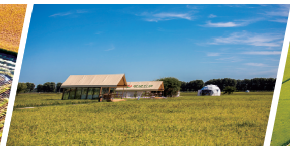
农旅融合的稻田风光别样美。