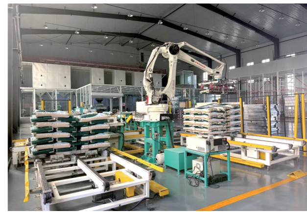
兴安盟草原三河有机农业开发有限公司加工车间。

如今,标准化体系让兴安盟大米产业焕发新生。截至目前,兴安盟稻田总面积近110万亩,其中绿色有机认证面积近80万亩。兴安盟已有大米生产加工主体57家,其中兴安盟大米授权使用企业38家,全口径加工量近30万吨,销售收入达18.5亿元,更多带有“兴安盟标准”的优质大米正走出内蒙古,走向全国。