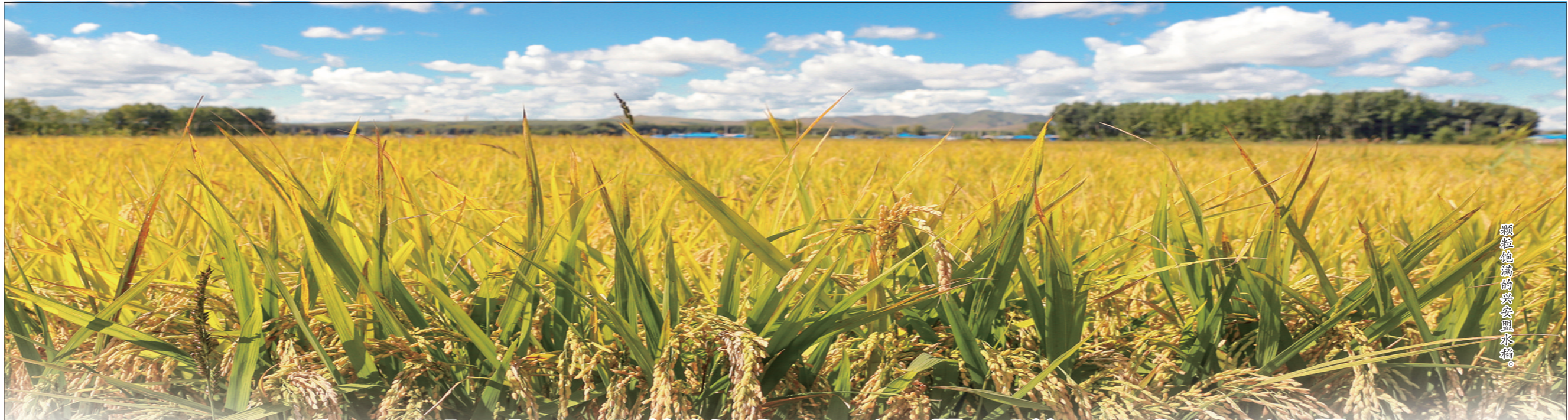
颗粒饱满的兴安盟水稻。