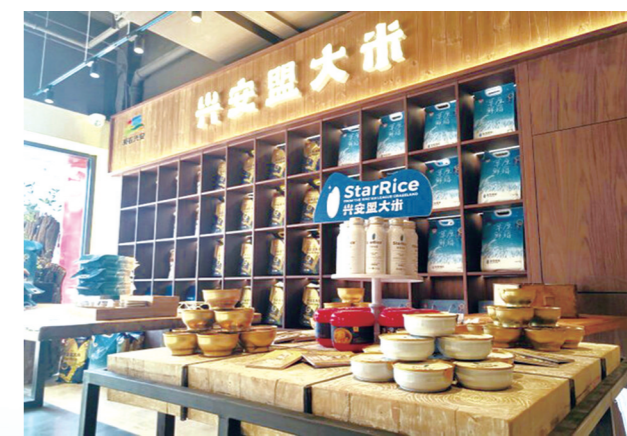
丰富的兴安盟大米衍生产品。

从“养在深闺”到飘香全国,从“原字号”到“金招牌”,兴安盟大米的蜕变,是生态优势转化为发展优势的生动实践,更是农业品牌化发展的北疆样本。这颗承载着兴安盟智慧与汗水的稻米,正以生态为根、标准为纲、品牌为翼,在乡村振兴的大道上稳步前行,书写着“一粒米撬动百亿产业”的精彩答卷。