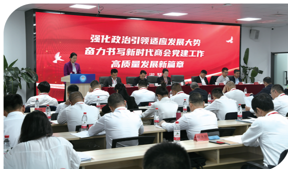
2024年12月,内蒙古自治区总商会党委召开第二次代表大会。