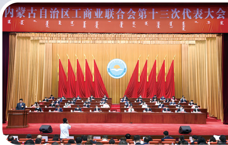
2022年8月,内蒙古自治区工商联第十三次代表大会召开。