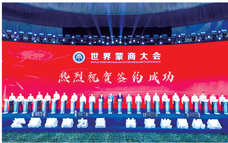
2023年7月,内蒙古自治区工商联举办世界蒙商大会。