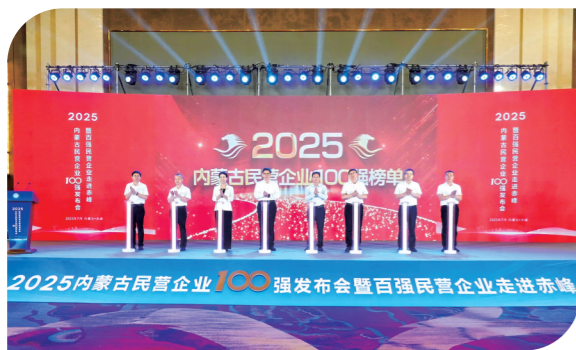
今年7月,内蒙古民营企业100强榜单发布。

七十载同心筑梦,九万里风鹏正举。内蒙古自治区工商联将以成立70周年为新的起点,坚持以习近平新时代中国特色社会主义思想为指导,深入学习贯彻党的二十大和二十届历次全会精神,贯彻落实习近平总书记对内蒙古系列重要讲话重要指示精神,以铸牢中华民族共同体意识为主线,认真落实自治区党委十一届十次全会精神,坚持和落实“两个毫不动摇”,促进“两个健康”,坚定信心、拼搏实干,团结带领广大民营经济人士不断开创事业新局面,为书写中国式现代化内蒙古新篇章汇聚更加磅礴力量、作出新的更大贡献。