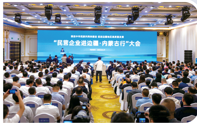
今年5月,“民营企业进边疆·内蒙古行”活动在巴彦淖尔市启幕。