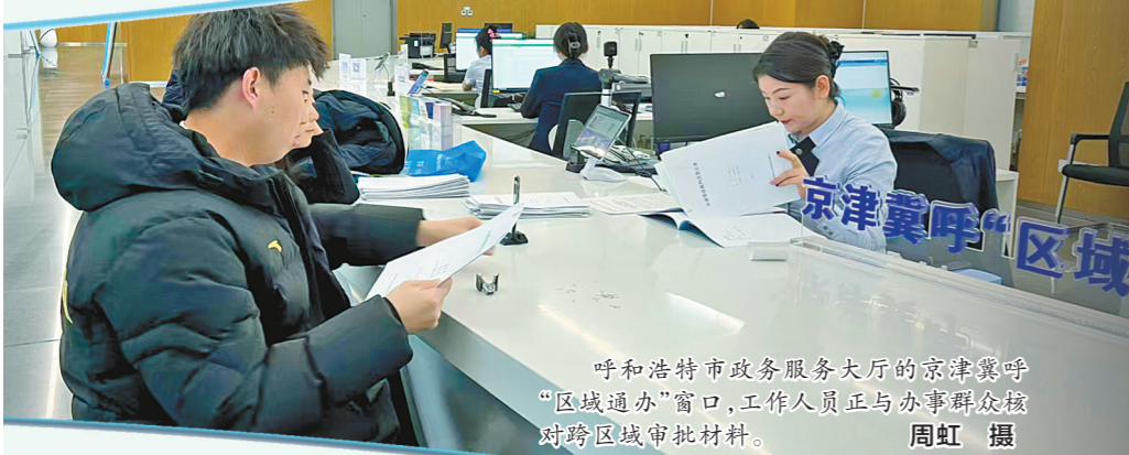
呼和浩特市政务服务大厅的京津冀呼“区域通办”窗口,工作人员正与办事群众核对跨区域审批材料。

事项台账,依托一体化政务服务平台推行并联审批,做到底数清、流程顺、效率高。 “多维画像”精准赋能,破解企业“审批迷茫”痛点。全市创新推出“工程建设项目多维画像”服务,启动“管家吹哨、部门联动、市区协作、一企一策”机制,为企业定制专属《项目审批画像表》,清晰列明责任部门、材料清单等关键信息;配备“项目管家”并建立帮办服务群,16个部门审批骨干在线值守,半小时内响应咨询。截至目前,已为390个项目精准画像,寄送《高效审批一封信》390封,助力146个项目顺利开工。内蒙古景丰生物科技有限公司“高活性腐植酸系列产品生产”项目,从拿地到取得工程规划许可证仅用1天。 下一步,呼和浩特市将持续深化审批制度改革,进一步精简下放审批事项,优化一体化政务服务平台功能,落实自治区“一平台、四清单、一机制”工作要求,以更实举措破解卡点难点,不断增强企业和群众的获得感。