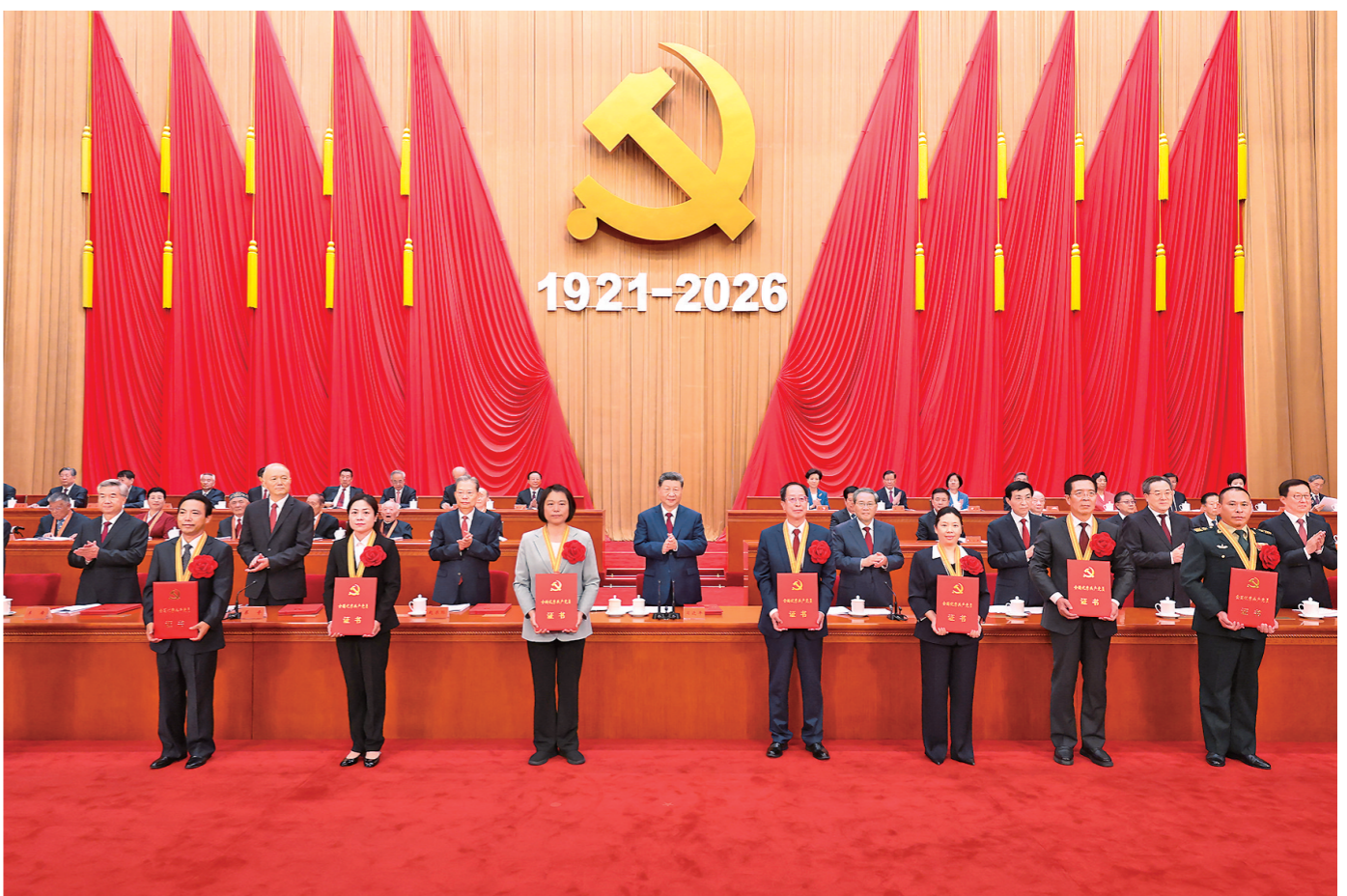
7月1日上午,庆祝中国共产党成立105周年大会在北京人民大会堂隆重举行。这是习近平等党和国家领导人为受表彰的全国“两优一先”代表颁奖。

表党中央,向全体中国共产党员致以节日问候!向“七一勋章”获得者,向受表彰的全国优秀共产党员、优秀党务工作者、先进基层党组织表示热烈祝贺! 习近平指出,105年前,在中国人民和中华民族的伟大觉醒中,在马克思列宁主义同中国工人运动的紧密结合中,中国共产党应运而生。从此,中国人民和中华民族有了最可靠的主心骨,内忧外患、积贫积弱的中国开启了翻天覆地的历史巨变。 习近平强调,105年来,我们党团结带领全国各族人民不懈奋斗,创造了新民主主义革命、社会主义革命和建设、改革开放和社会主义现代化建设、新时代中国特色社会主义的伟大成就,书写了中华民族几千年历史上最恢宏的史诗。105年不懈奋斗,从根本上改变了中国人民的前途命运,开辟了实现中华民族伟大复兴的正确道路,展示了马克思主义的强大生命力,深刻影响了世界历史进程,锻造了强大的中国共产党。我们党完全无愧为伟大光荣正确的党。 习近平指出,中国共产党之所以能够在105年奋斗中不断铸就辉煌,历史和人民之所以选择中国共产党,根本在于我们党具有其他政党和政治力量无可比拟的优秀特质。我们党矢志追求真理、始终把准前进方向,深深植根人民、始终拥有坚实根基,勇担历史使命、始终掌握战略主动,顺应发展潮流、始终走在时代前列,敢于善于斗争、始终保持必胜信心,注重强健自身、始终充满生机活力。我们要结合新的实际,把党的优秀特质不断发扬光大,确保党永远不变质不变色不变味,始终具有强大创造力凝聚力战斗力。 习近平强调,实现新时代新征程党的使命任务,要求全体中国共产党人坚定信心、接续奋斗,不断创造无愧于时代和人民的新业绩。坚定信心、接续奋斗,必须坚持党的基本理论、基本路线、基本方略,坚持党的全面领导和党中央集中统一领导,深入贯彻新时代中国特色社会主义思想,坚定道路自信、理论自信、制度自信、文化自信,继往开来、守正创新,做到不畏浮云遮望眼、乘风破浪不迷航。必须紧紧依靠人民创造历史伟业,践行以人民为中心的发展思想,充分激发亿万人民的积极性主动性创造性,统筹推进“五位一体”总体布局、协调推进“四个全面”战略布局,完整准确全面贯彻新发展理念,加快构建新发展格局,扎实推动高质量发展。必须积极应对前进道路上的风险挑战,强化忧患意识、坚持底线思维,发扬斗争精神、增强斗争本领,更好统筹国内国际两个大局,统筹发展和安全。必须持续推动构建人类命运共同体,高举和平、发展、合作、共赢旗帜,弘扬全人类共同价值,推动落实全球发展倡议、全球安全倡议、全球文明倡议、全球治理倡议,为世界和平与发展注入更多正能量。必须持之以恒推进全面从严治党,