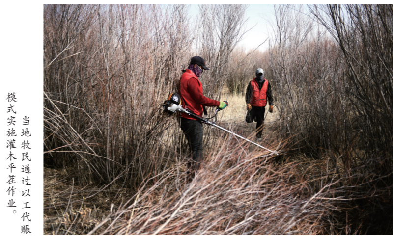
当地牧民通过以工代赈模式实施灌木平茬作业。