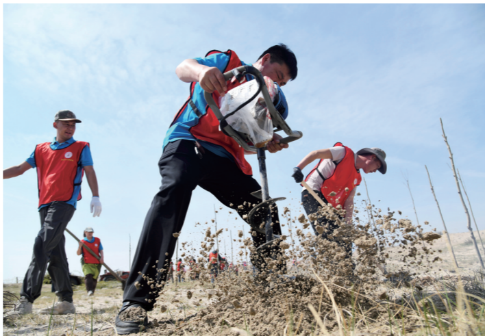
志愿者们在沙地歼灭战的战场上挥汗如雨。