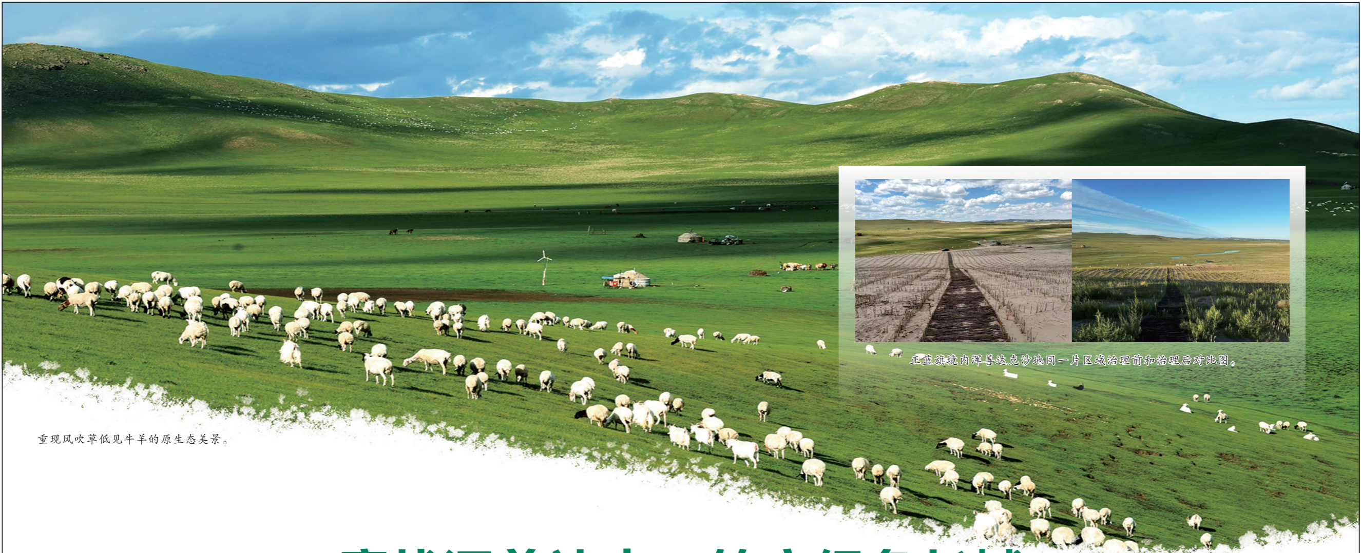
重现风吹草低见牛羊的原生生态美景。