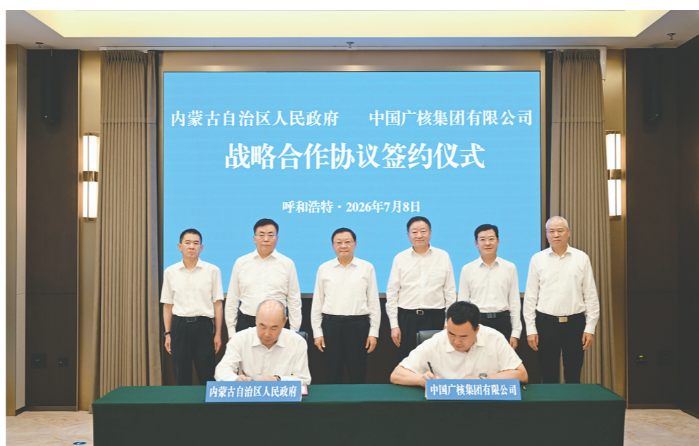
7月8日，自治区党委书记、人大常委会主任王伟中，自治区党委副书记、自治区人民政府主席包钢在呼和浩特会见中国广核集团董事长杨长利、总经理庞松涛，并共同见证双方签约。

杨长利感谢自治区党委、政府给予中广核的关心支持，并介绍了企业产业布局与发展情况。他表示，内蒙古地域辽阔、资源丰富，是中广核产业发展的战略核心区域。面向“十五五”，中广核将立足双方良好合作基础，深入践行绿色发展理念，持续加大投资布局力度，统筹推进风光制氢、光热发电、光伏治沙、绿电直供、核技术应用等项目建设，切实承担起央企责任，为内蒙古建设国家重要能源和战略资源基地贡献更大力量。 自治区领导于立新参加。