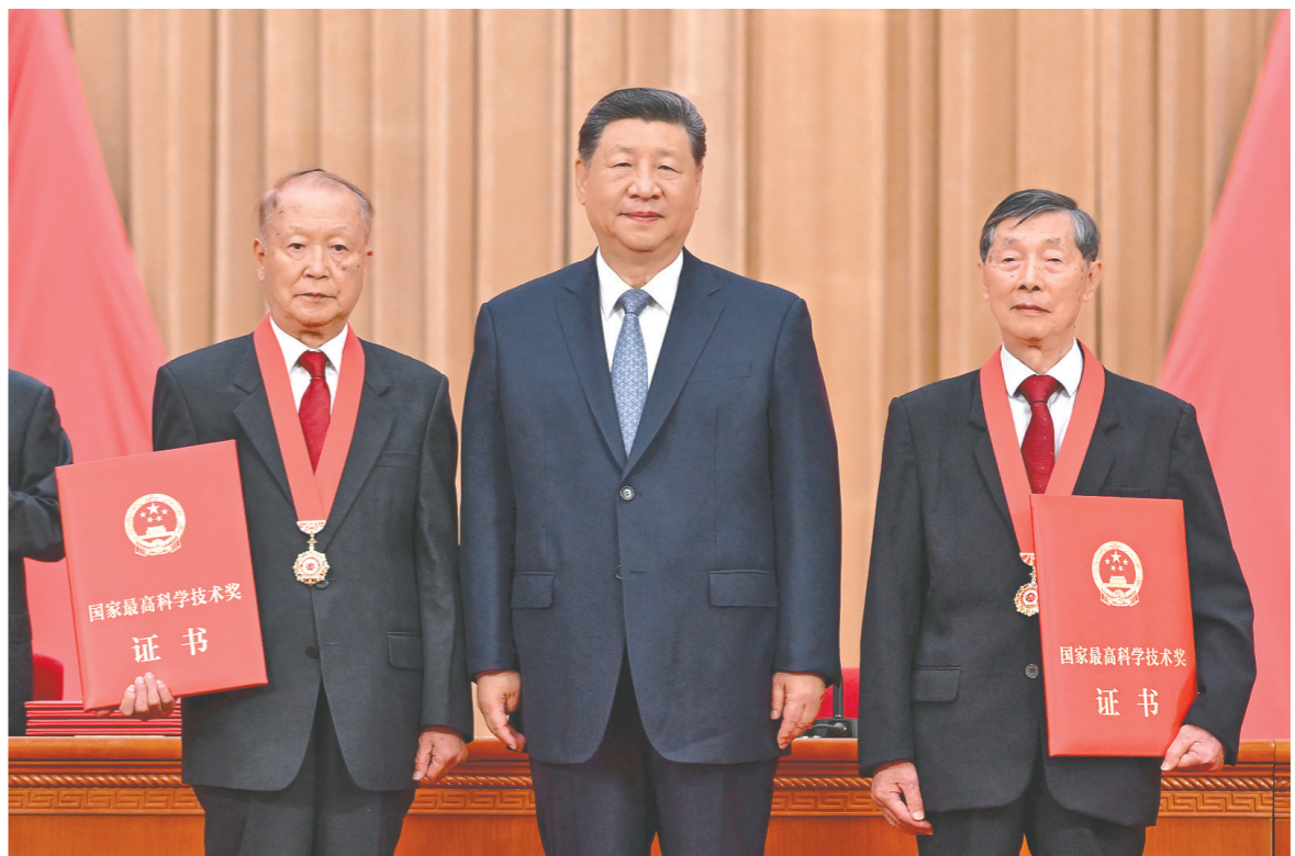
七月八日上午，国家科学技术奖励大会、中国科学院第二十二次院士大会和中国工程院第十八次院士大会、中国科学技术协会第十一次全国代表大会在北京人民大会堂隆重召开。中共中央总书记、国家主席、中央军委主席习近平向获得二〇二五年度国家最高科学技术奖的中国科学院物理研究所陈立泉院士（右）和中国电子科技集团第四十四研究所贵德院士（左）颁奖。

新华社北京7月8日电 国家科学技术奖励大会、中国科学院第二十二次院士大会和中国工程院第十八次院士大会、中国科学技术协会第十一次全国代表大会8日上午在人民大会堂隆重召开。中共中央总书记、国家主席、中央军委主席习近平出席大会，为国家最高科学技术奖获得者等颁奖并发表重要讲话。他强调，“十五五”时期是科技强国建设的关键攻坚期。必须抓住历史机遇，迎接时代挑战，加快推进高水平科技自立自强，向着到2035年建成科技强国的目标坚定迈进，扎扎实实以科技创新支撑和引领中国式现代化。